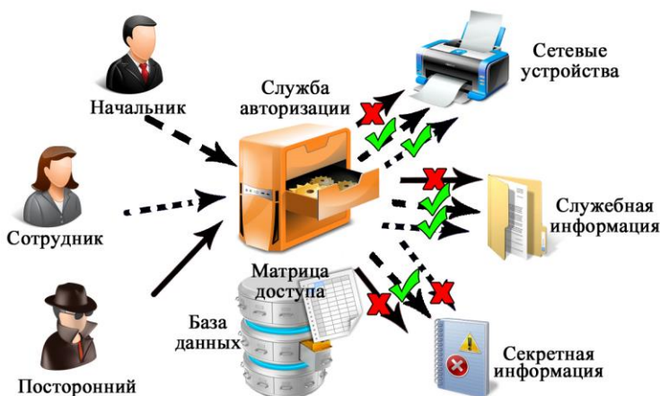
Рисунок 1 – Схема реализации дискреционного управления доступом